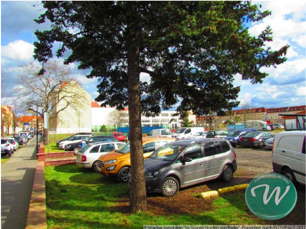
© Wacker Immobilien "Im Grünen Norden von Berlin". Präsentiert durch FLOWFACT 2017