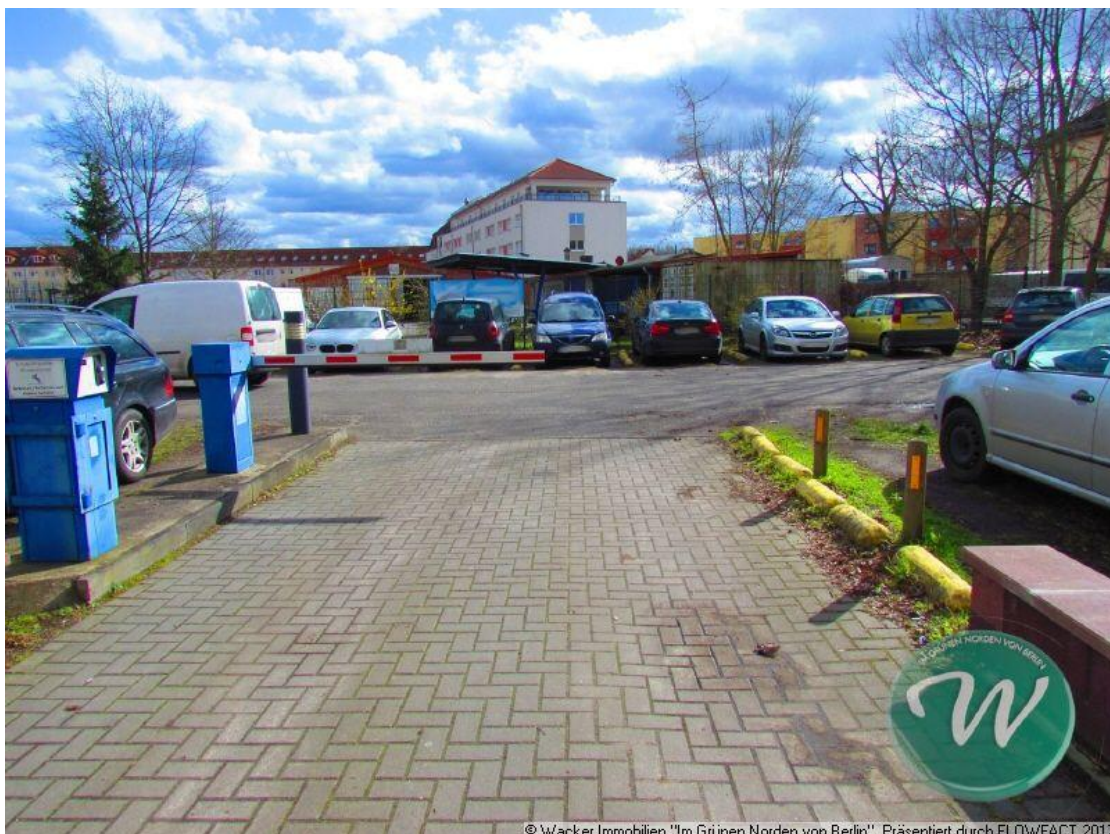
Grundstück - zum Teil Parkfläche

© Wacker Immobilien "Im Grünen Norden von Berlin". Präsentiert durch FLOWFACT 2017