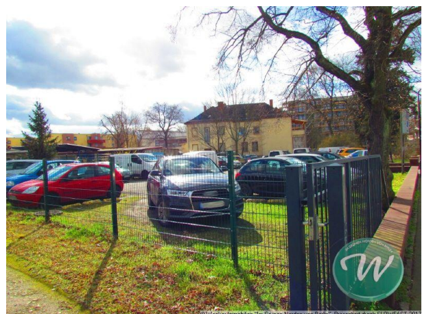
© Wacker Immobilien "Im Grünen Norden von Berlin". Präsentiert durch FLOWFACT 2017