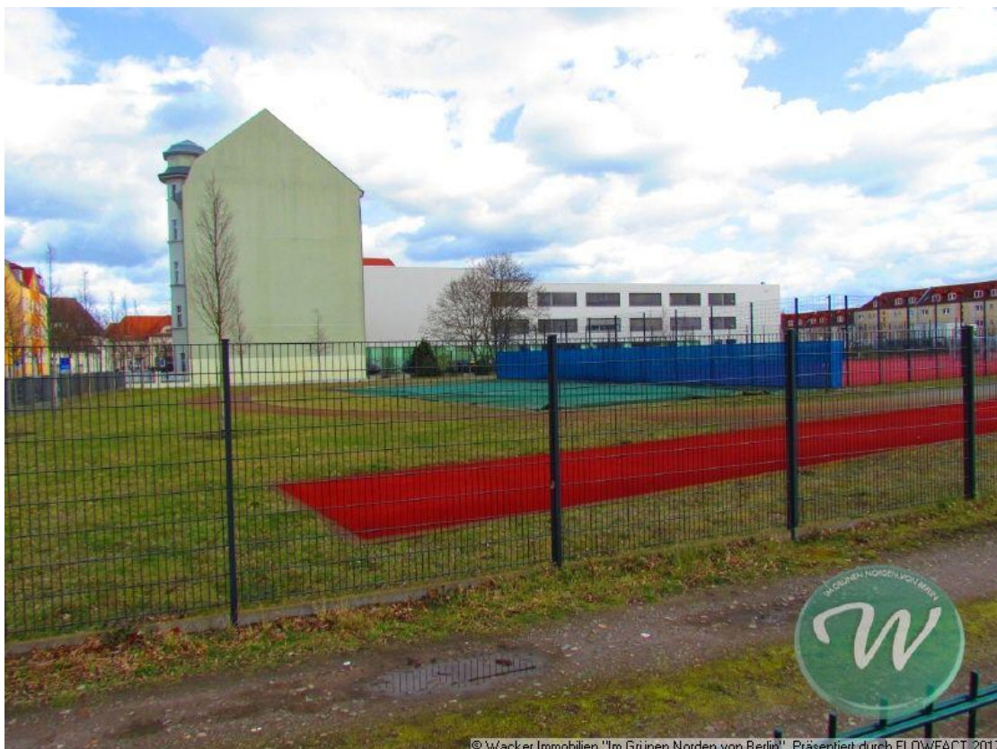
Willi-Brandt-Str - Blick von gegenüber

© Wacker Immobilien "Im Grünen Norden von Berlin". Präsentiert durch FLOWFACT 2017