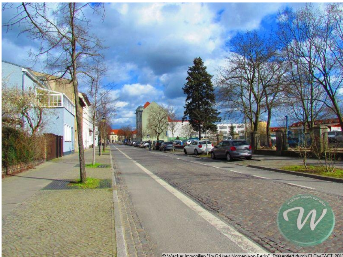
Blick in Richtung Lehnitzstraße

© Wacker Immobilien "Im Grünen Norden von Berlin". Präsentiert durch FLOWFACT 2017