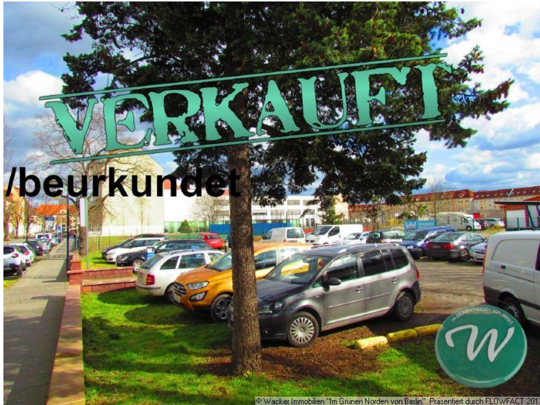
Grundstück - zum Teil Parkfläche