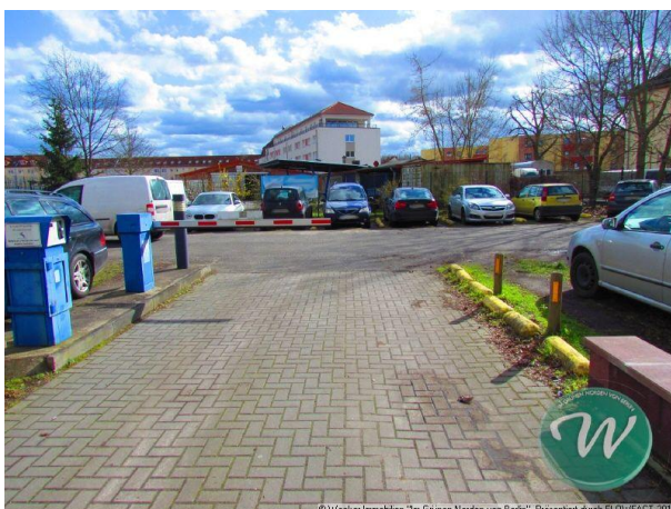
"Im Grünen Norden von Berlin". Präsentiert durch FLOWFACT 2017